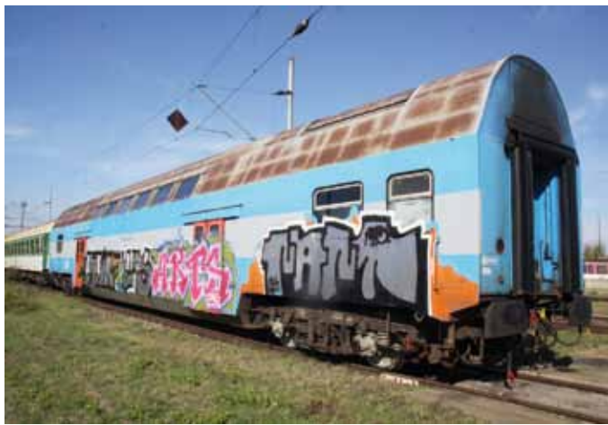
HROZBA. Sprejeři se snaží omezit riziko dopadení, a proto rádi útočí na vagony odstavené na odlehlejších místech.

Sprejeři samozřejmě svým počínáním zhoršují podmínky ces-