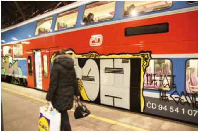
ŠPATNÁ VIZITKA. Než se počmáraný vůz či souprava dostanou na čištění, mohou ještě několik dní sloužit. Cestujícím přímo na očích.